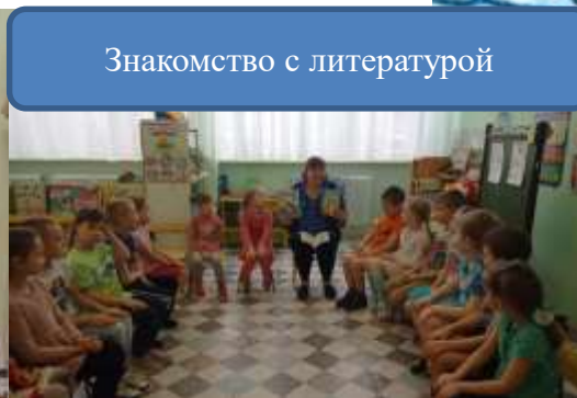
Знакомство с литературой