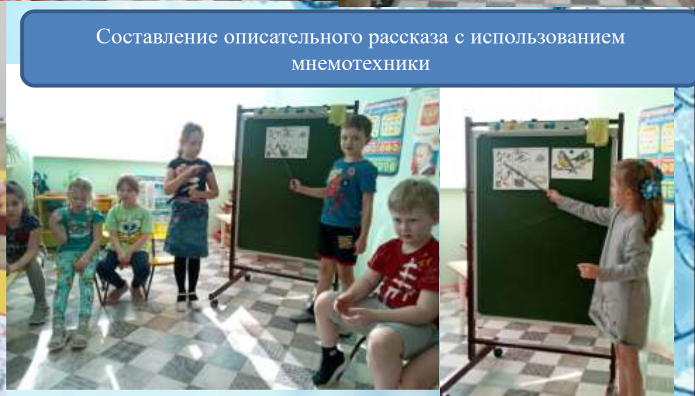
Составление описательного рассказа с использованием мнемотехники