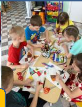
Конструирование из бумаги, в технике оригами