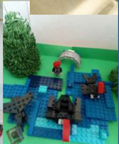
Лего - конструирование