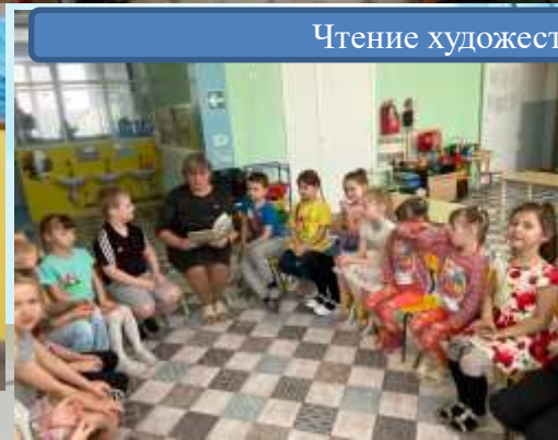
Чтение художественной литературы